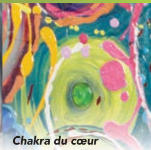
Chakra du cœur

Merci à tous nos partenaires culturels 2018!